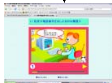
「ネット社会の歩き方」より