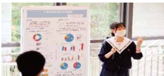
人間科学類型発表会

世界が身近になった今、国際的な視野を持ち様々なことにチャレンジしていくことが大切です。このための取り組みを、本校では“HGLC”(Hokusan Global Leadership Challenge)と呼んでいます。オーストラリアの姉妹校と提携し、長期滞在型の 留学生交換 や、夏休みに 短期海外研修 などを実施しています。(昨年度は中止)