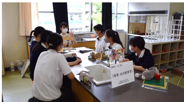
2年生 分野別説明会

1年生では、憧れの職業に就かれている方に職業人インタビューを行います。仕事の「やりがい」や「面白さ」について掘り下げていきます。また、専門学校や大学の講師の方をお招きし、興味のある仕事について校内で就業体験を行っています。より専門的な体験を通して、将来の自分像を創り上げていきます。