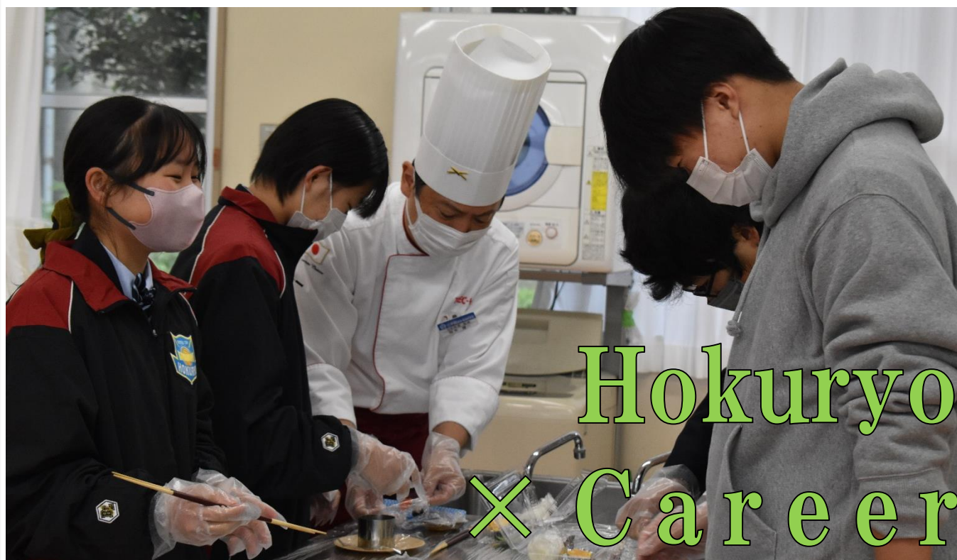
1年生 職業体験の様様 ※内容は年度によって異なります