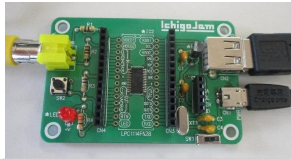
これが IchigoJam です。LED ランプの点滅や、ゲームプログラムの入力体験をしました。