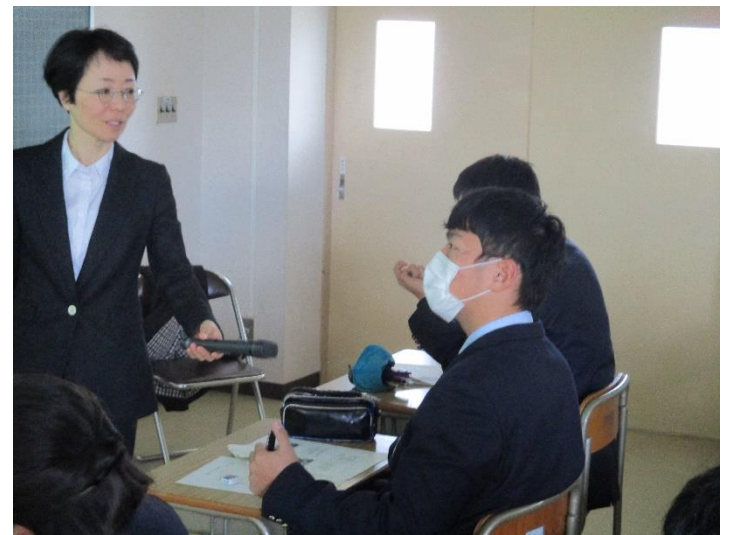
時折先生から質問もありました