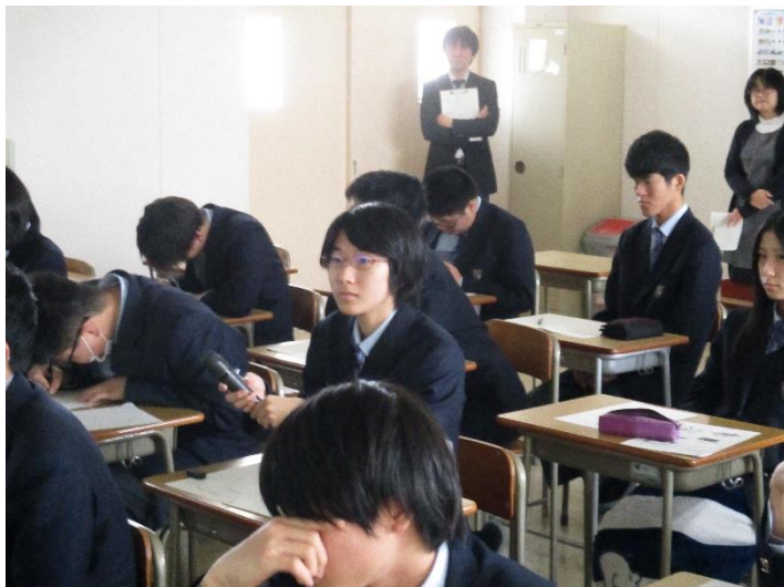
最後にはマイクを渡してもらい考えを話しました