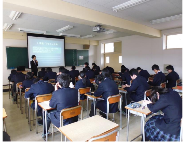
講義中の様子です