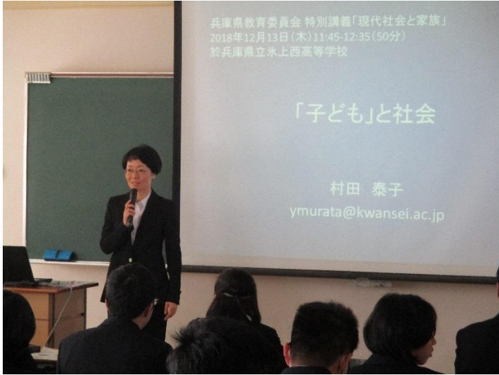
講義がはじまりました

1 学年生徒を対象に、『子ども』と社会』と題して、兵庫県教育委員である関西学院大学の村田泰子教授に授業をしていただきました。生徒たちには難しい内容もあったかもしれませんが、村田教授の質問にもしっかり答え、非常に有意義な特別講義となりました。