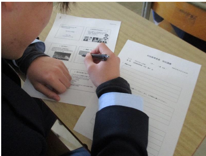
ワークシートに書き込んでいきます