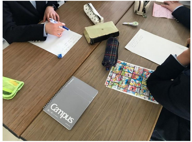
辞書を使いながら夢中になります