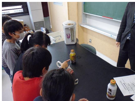
空き缶が突然へこみます。