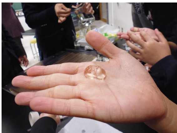
実験で作った「持てる水」です。