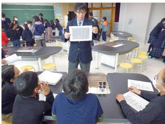
錯視の説明中です。