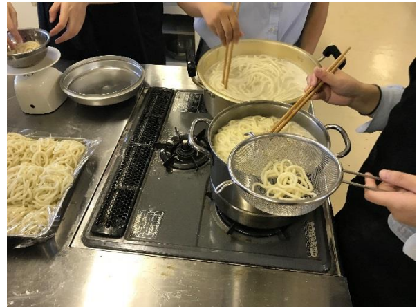
麺をゆでて準備完了