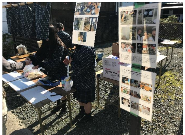
売ります。毎度ありがとうございます