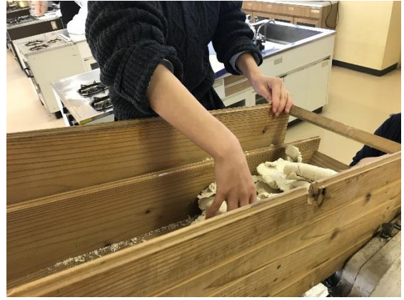
機械を始動させます