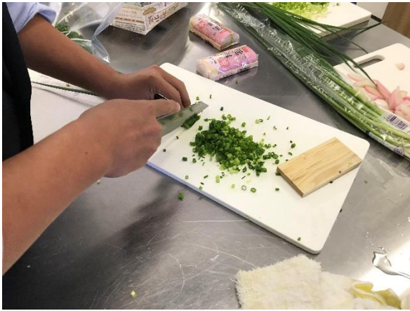
ねぎ等の準備も始まりました