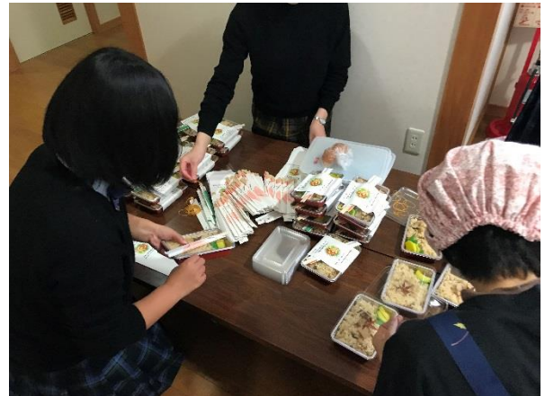
お弁当作りも手伝いながら