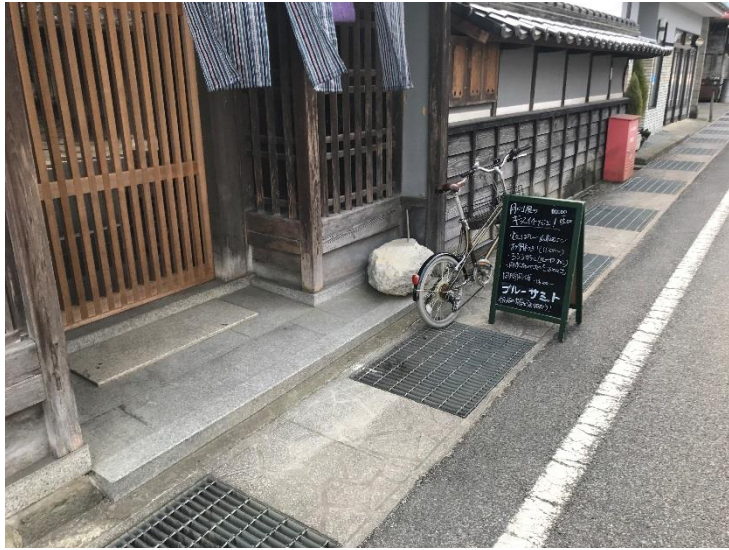
毎月第4日曜はキヌイチが行われているのです