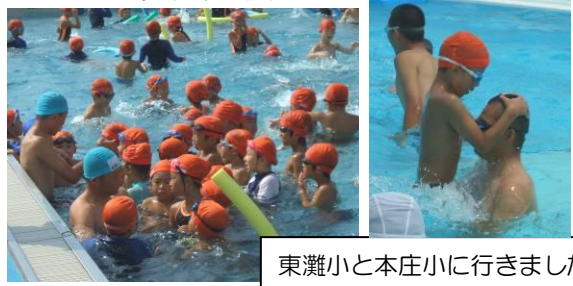
東灘小と本庄小に行きました