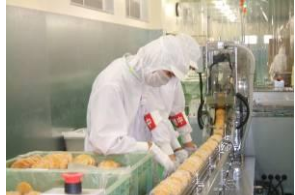
食品工場での職業体験です