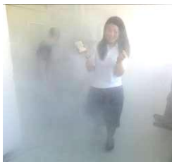
煙の中は意外とたいへん