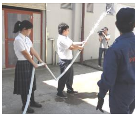
防火水槽の水で消火体験