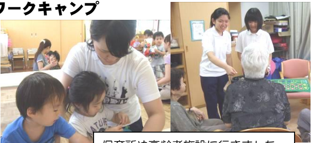
保育所や高齢者施設に行きました