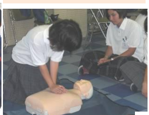
心臓マッサージ体験です