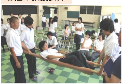
竹の棒と毛布を利用した担架です