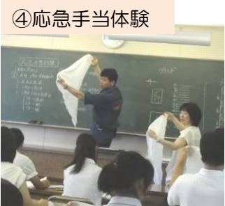
三角巾の使い方の実習です