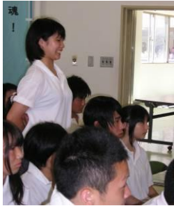
生徒も意見を発表しました