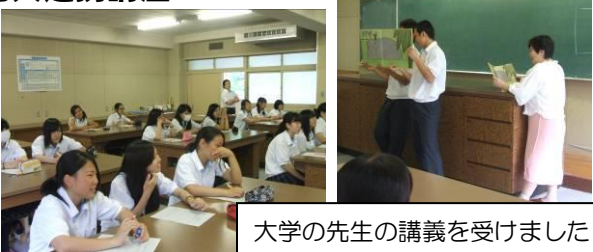
大学の先生の講義を受けました