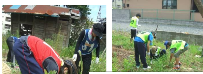
宮城県石巻市の湊小学校周辺で草引きをしました