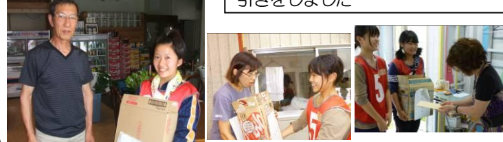
深江浜の企業からの心のこもった救援物資を東灘高生の笑顔とともにお届けしました