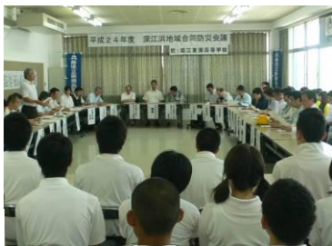
司会は生徒会がしました