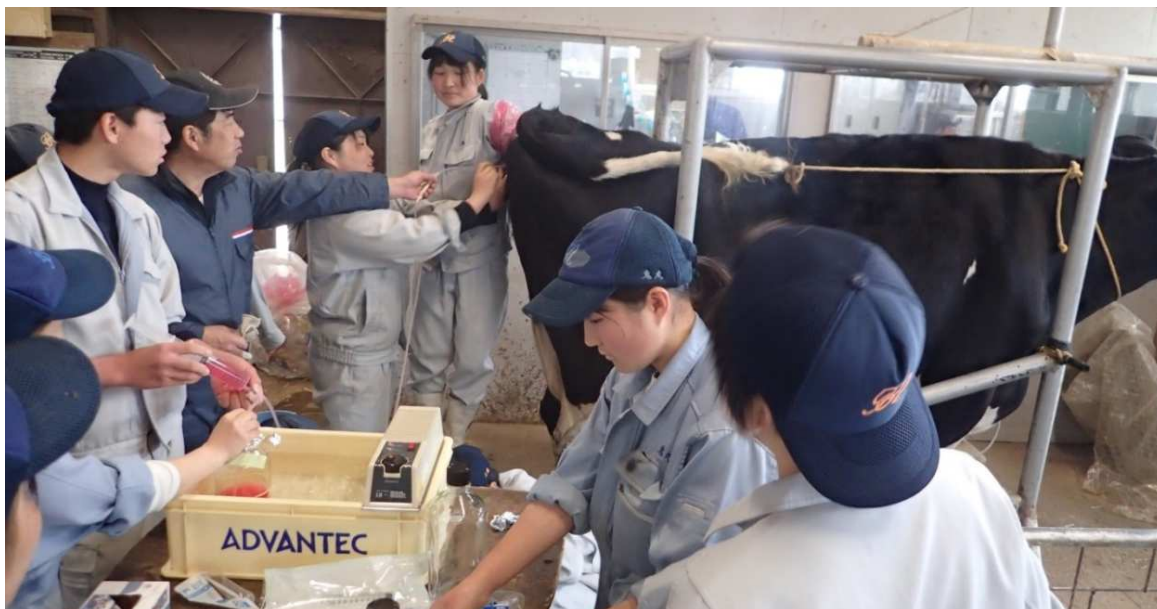
計画的な体内受精卵回収