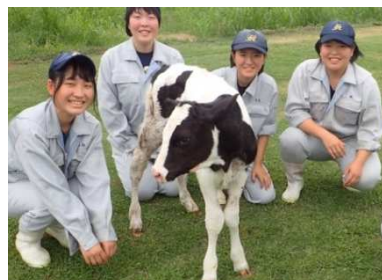
誕生した♀受精卵移植牛

乳牛の増殖・改良として脚光を浴びている受精卵移植技術であるが、個体差により受精卵回収数変動し安定した受精卵確保ができないという問題を調査・研究した結果、私たちは「個体差の問題」でなく「個体の状態による問題」であることを解明し、ボディ・コンディション・スコア（BCS）と優勢卵胞除去を用いることで効率よく数多くの受精卵確保が可能となることを立証しました。