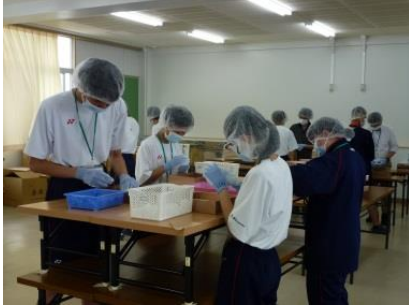
【ケミカルキャップ】

1年生は5日間の校内作業に取り組みました。作業内容は、ケミカルキャップ、ギフトセットの梱包、バリ取り等で、最初は作業に慣れず、とまどいも見られましたが、時間が経過するとともに作業速度や正確性が上がっていました。実際に薬局で使用されたり、ネットで販売されたりする商品を扱うので、成果がわかりやすく、より充実した実習となりました。初めての实習で、体力的にも大変だったと思いますが、やり遂げることによって、生徒達は一回り成長することができたように思います。