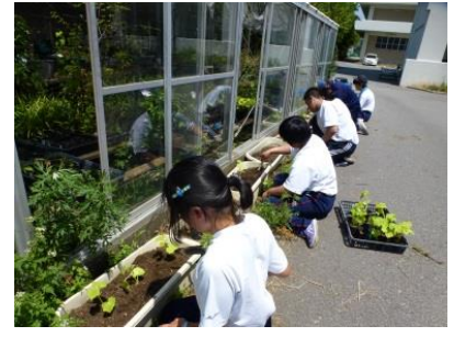
【スクールメンテナンス】