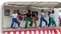
3年生最後のステージ