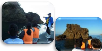
この時期には珍しい、穏やかな海でした

グローカルキャリア類型の特色ある学習の一環で、「地域探究フィールドワーク」を実施しました。第1弾は山陰ジオパークである「御火浦」へ。漁船での洞門周辺の遊覧と、郷土料理「イカのなれ寿司」等、地元加工産業の見学を行いました。世界遺産である地形を間近で見たり、地元産業の歴史の説明を受け伝統料理を試食したり...身近にありながら知らないことも多く、生徒たちにとって「地域」を知る貴重な機会となりました。ご協力いただいた「御火浦」地域の皆様にご心よりお礼申し上げます。今後、第2弾、第3弾で「地域」をもっと知っていきます。