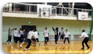
生徒 v.s 職員

総合コース3年「スポーツⅡ」選択者が企画、運営して、バスケットボール大会を行いました。スポーツをする側だけではなく、支える経験を通して、計画性や自発性、人を動かすコミュニケーション能力の向上を狙っています。有志生徒によるチームと職員チームの参加があり、ゲームを楽しみました。日ごろ見られない生徒や職員の表情や姿に、大いに盛り上がりました。