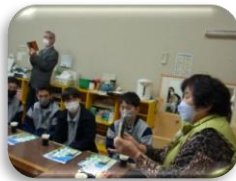
「地エビのビスク」に舌鼓