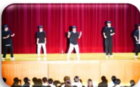
個性溢れる パフォーマンスが次々!