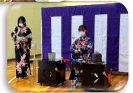
美味しいものたくさん!