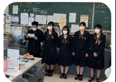
生徒会長が職員朝礼で提案

昨今、校則の見直し話題になっていますが、本校においても、スマホ使用のルール改正について生徒会から提案がありました。現在、本校ではスマホの校地内での使用を禁じていますが、時間、場所を限った使用を許可してほしいというものです。生徒会で練ったルールで試行し、生徒会が監督してルールが遵守できれば改正を…と職員、生徒に説明があり、5月から試行となります。誰もが過ごしやすく気持ちよく過ごせる学校について生徒自らが考え、行動する自主的・創造的な活動として大いに奨励し、今後を温かく見守っていきたいと思います。