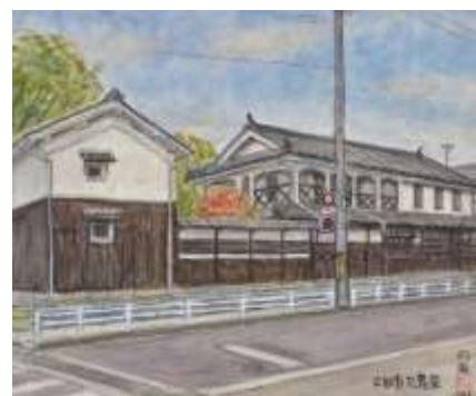
内海敏夫「三田市旧九鬼家住宅」 兵庫県立歴史博物館蔵