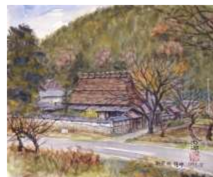
内海敏夫「朝来町佐中(佐中の千年家)」 兵庫県立歴史博物館蔵