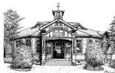
沢田伸「大正ロマン館 (丹波篠山市)」 個人蔵

①令和2年1月25日 (土)、②2月15日 (土)、③3月14日 (土) いずれも午前11時から展覧会場にて。 申込不要 参加無料 (ただし会場へは特別企画展観覧料が必要)