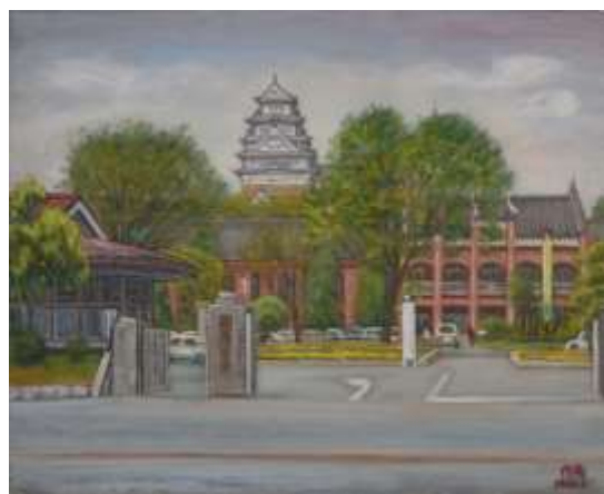
2. 内海敏夫「姫路城大天守と旧市役所」 兵庫県立歴史博物館蔵