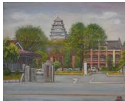
内海敏夫「姫路城大天守と旧市役所」 兵庫県立歴史博物館蔵