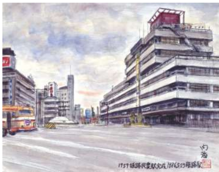
内海敏夫「国鉄姫路駅」 兵庫県立歴史博物館蔵