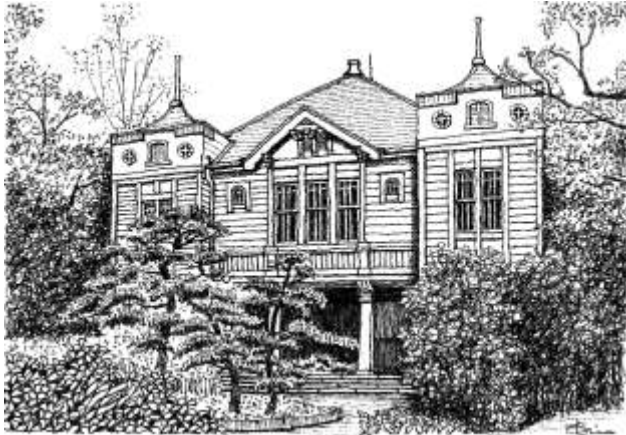
5. 沢田伸「兵庫県立大学講堂（姫路市）」個人蔵