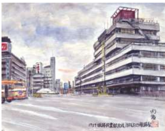
1. 内海敏夫「国鉄姫路駅」兵庫県立歴史博物館蔵