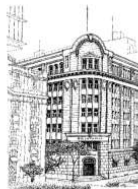
沢田伸「商船三井ビル (神戸市)」 個人蔵

日 時：令和2年1月31日 (金) 午後1時～4時 場 所：当館ロビー集合・解散 費 用：保険料 (100円) 定 員：30名 (事前申込：参加者が20名に達しない場合は開催しません。) ※申込期間＝令和元年12月13日 (金)～12月27日 (金) ※申込方法＝申込期間中に当館ホームページから、 もしくは往復はがきにて受付。