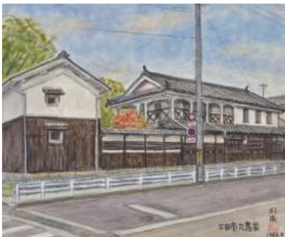
3. 内海敏夫「三田市旧九鬼家住宅」 兵庫県立歴史博物館蔵