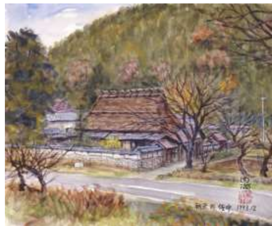
4. 内海敏夫「朝来町佐中（佐中の千年家）」 兵庫県立歴史博物館蔵