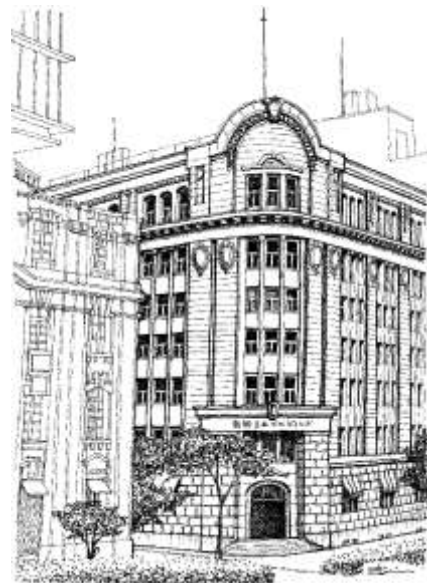
8. 沢田伸「商船三井ビル（神戸市）」個人蔵