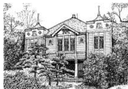
沢田伸「兵庫県立大学講堂（姫路市）」 個人蔵