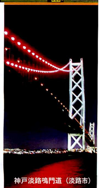
神戸淡路鳴門道 (淡路市)

本年夏、兵庫の地で開催される全国研究大会に多くの皆様が集い、繋がることを心より期待申し上げます。