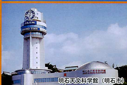
明石天文科学館 (明石市)