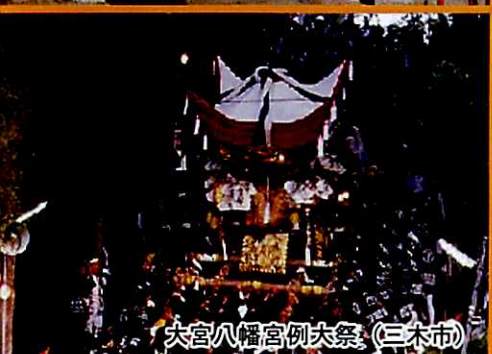
大宮八幡宮例大祭 (三木市)