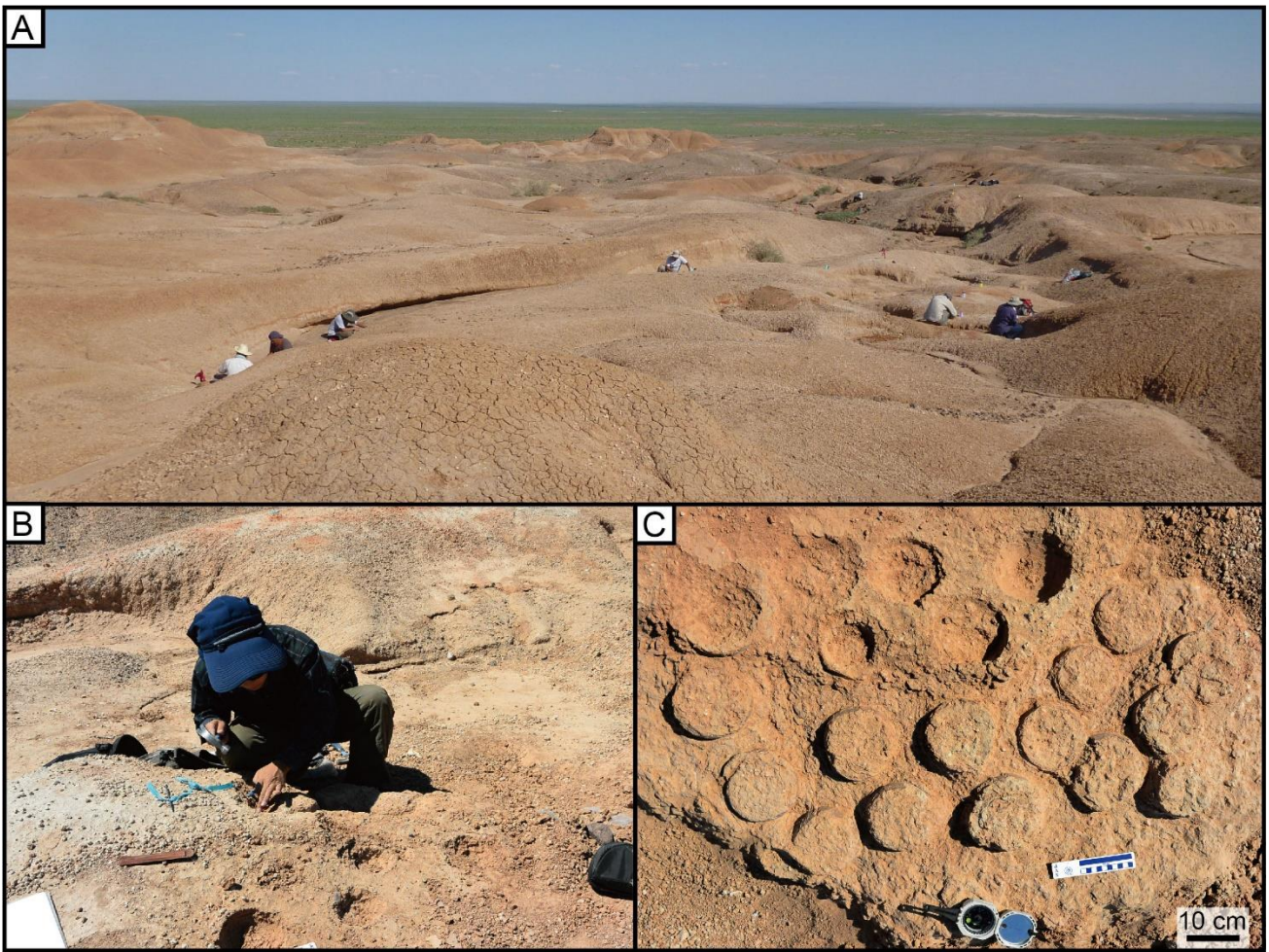
図1. (A) モンゴル ゴビ砂漠東部のテリジノサウルス類集団営巣跡発見場所。人がいる地点で巣化石が確認されています。(B) 発掘の様子。(C) 巣化石の例。丸い卵化石が並んでいることが分かります。