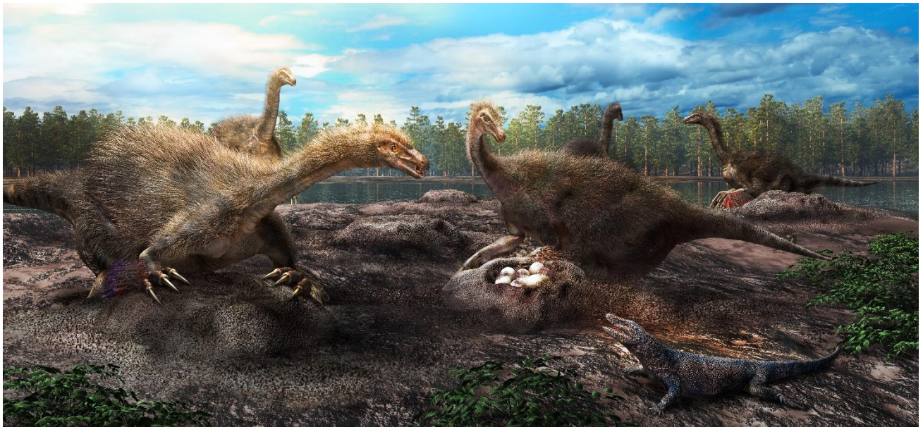
図3. テリジノサウルス類恐竜の集団営巣の復元図。復元画提供：服部雅人氏。