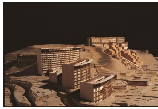
【六甲の集合住宅 rokko housing 模型】