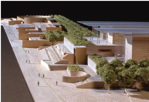
【震災復興プロジェクト 兵庫県立美術館＋神戸市水際広場 模型】