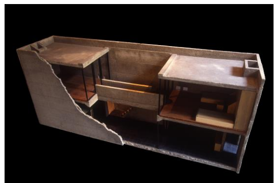
【住吉の長屋 row house, sumiyoshi 模型】