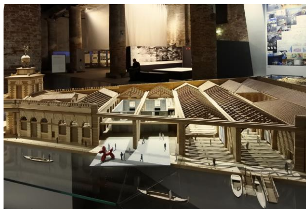
【プンタ・デラ・ドガーナ punta della dogana 模型】