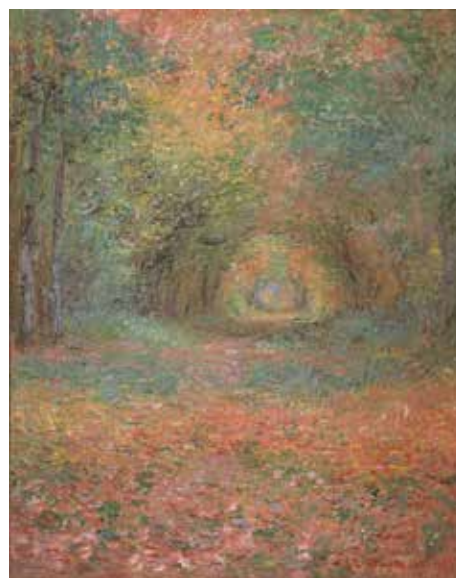
13) クロード・モネ《サン=ジェルマンの森の中で》 1882年 油彩／カンヴァス 吉野石膏コレクション