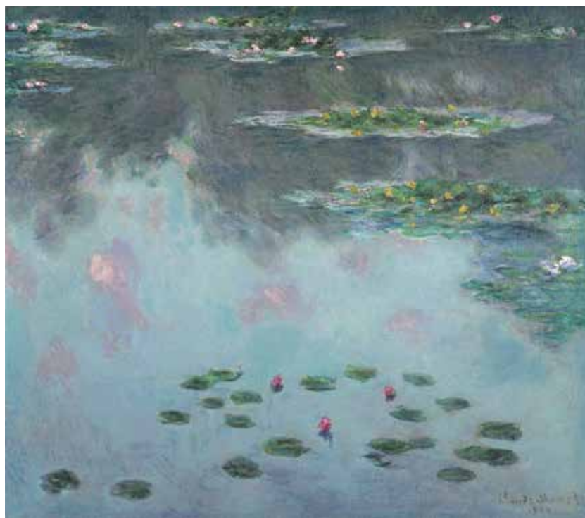
1) クロード・モネ《睡蓮》1906年 油彩/カンヴァス 吉野石膏コレクション