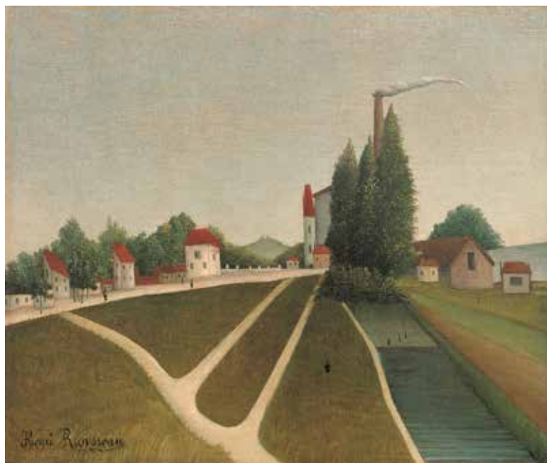
16) アンリ・ルソー 《工場のある町》1905年 油彩/カンヴァス 吉野石膏コレクション

ジョルジュ・ルオー (1871-1958)、ピエール・ボナール (1867-1947)、アンリ・マティス (1869-1954)、アルベール・マルケ (1875-1947)、モーリス・ド・ヴラマンク (1876-1958)、アンリ・ルソー (1844-1910)、ジョルジュ・ブラック (1882-1963)、ジョアン・ミロ (1893-1983)、パブロ・ピカソ (1881-1973)、ワシリー・カンディンスキー (1866-1944)