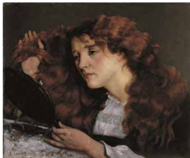
6) ギュスターヴ・クールベ 《ジョーの肖像、美しいアイルランド女性》 1872年頃 油彩／カンヴァス 吉野石膏コレクション