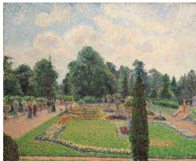
9) カミーユ・ピサロ 《ロンドンのキューガーデン、大温室前の散歩道》 1892年 油彩／カンヴァス 吉野石膏コレクション