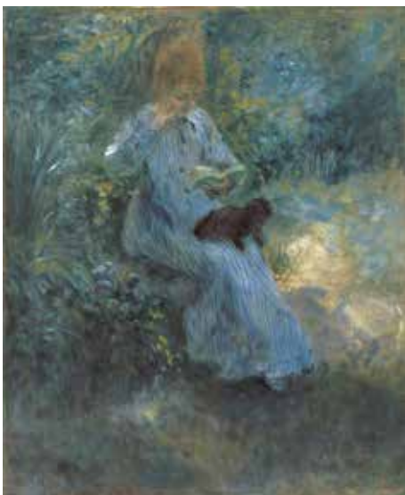
14) ピエール=オーギュスト・ルノワール《庭で犬を膝にのせて読書する少女》 1874年 油彩／カンヴァス 吉野石膏コレクション