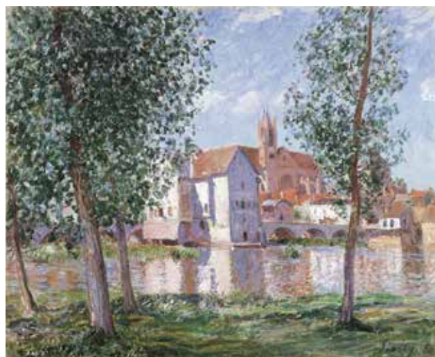
11) アルフレッド・シスレー《モレ=シュル=ロワン、朝の光》1888年 油彩／カンヴァス 吉野石膏コレクション