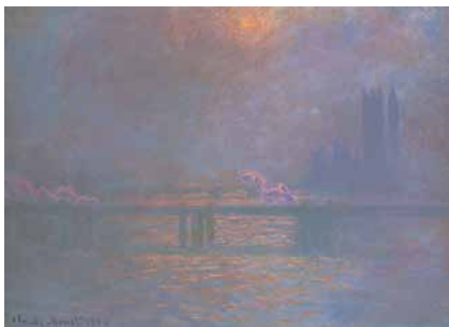
12) クロード・モネ《テムズ河のチャリング・クロス橋》1903年 油彩／カンヴァス 吉野石膏コレクション