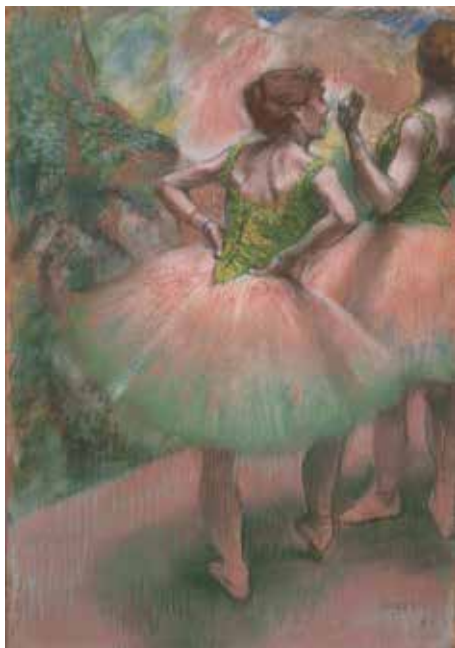
10) エドガー・ドガ《踊り子たち（ピンクと緑）》 1894年 パステル／紙 吉野石膏コレクション