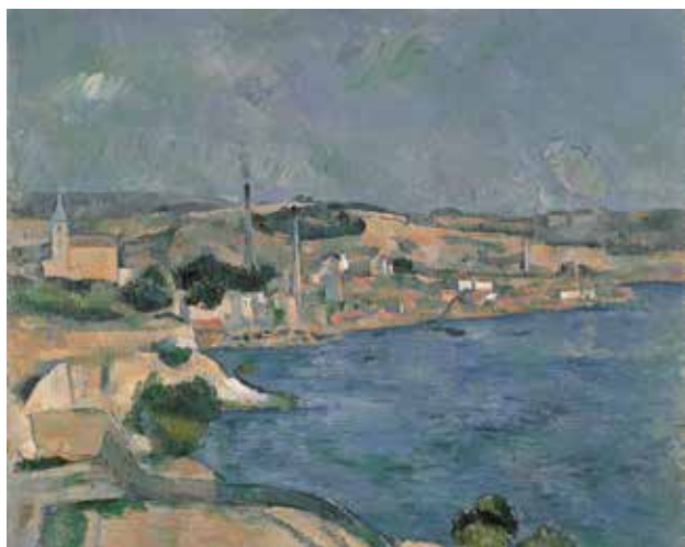
5) ポール・セザンヌ 《マルセイユ湾、レスタック近郊のサンタンリ村を望む》 1877-79年 油彩／カンヴァス 吉野石膏コレクション