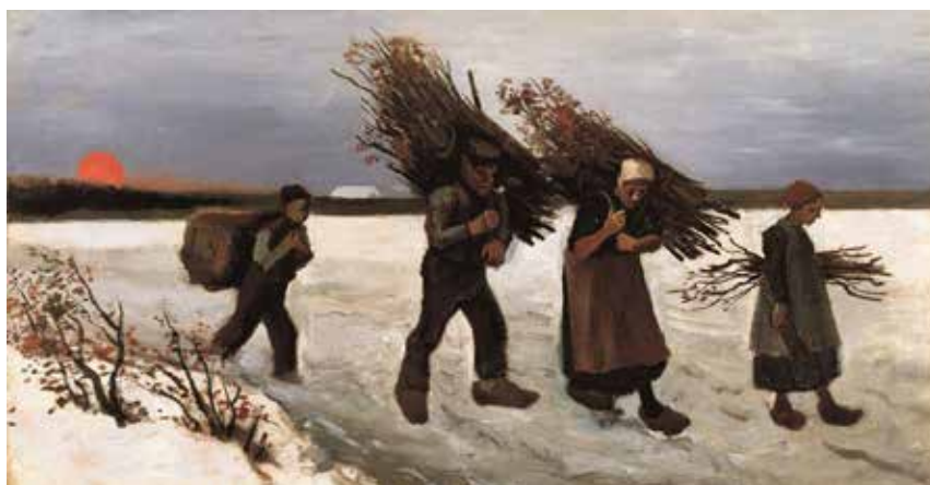
7) フィンセント・ファン・ゴッホ 《雪原で薪を運ぶ人々》1884年 油彩／カンヴァス 吉野石膏コレクション