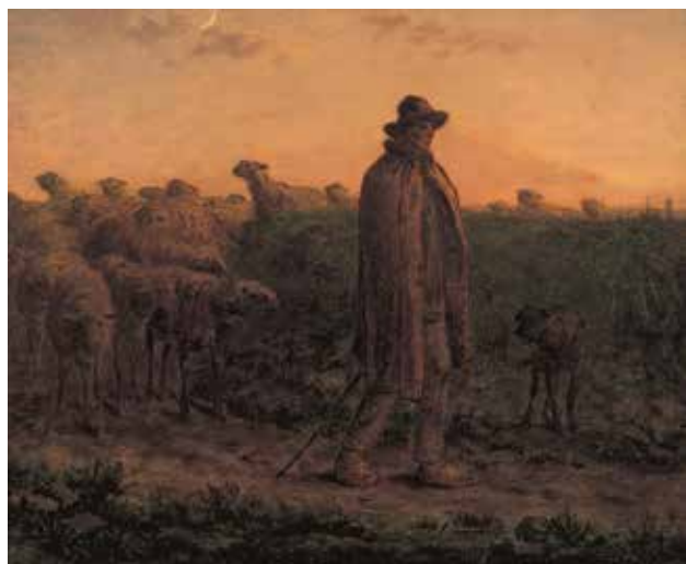
8) ジャン＝フランソワ・ミレー 《群れを連れ帰る羊飼い》1860-65年 油彩、パステル、インク、黒コンテ／カンヴァス 吉野石膏コレクション