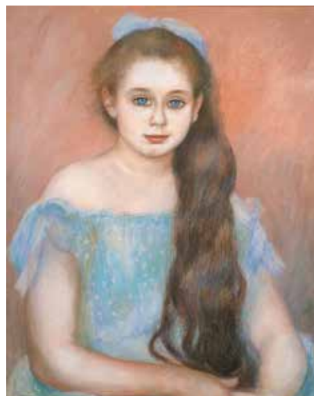
15) ピエール=オーギュスト・ルノワール《シュザンヌ・アダン嬢の肖像》 1887年 パステル／紙 吉野石膏コレクション