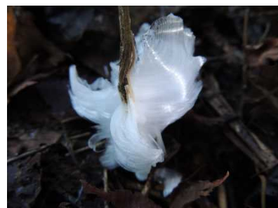
シモバシラの茎から伸びた氷