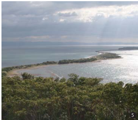
① 香住海岸（今子浦） ② 里山（川西市） ③ 上山高原 ④ ため池（三田市） ⑤ 成ヶ島