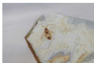
昆虫化石(ハチの一種)