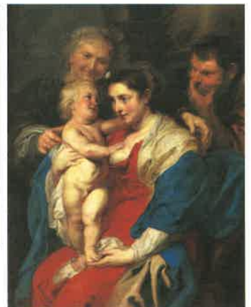
上：ティツィアーノ《音楽にうつろくヴィーナス》 1550年頃 右下：ペーテル・パウル・ルーベンス《聖アンナのいる聖家族》 1630年頃 左下：ヤン・フェルメール(父)《花卉》 1615年

作品はいずれもマドリド、プラド美術館蔵