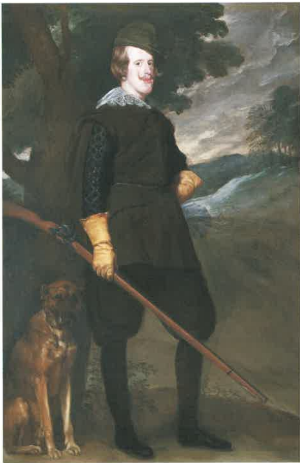
ディエゴ・ベラスケス《狩猟服姿のフェリペ4世》 1632-34年