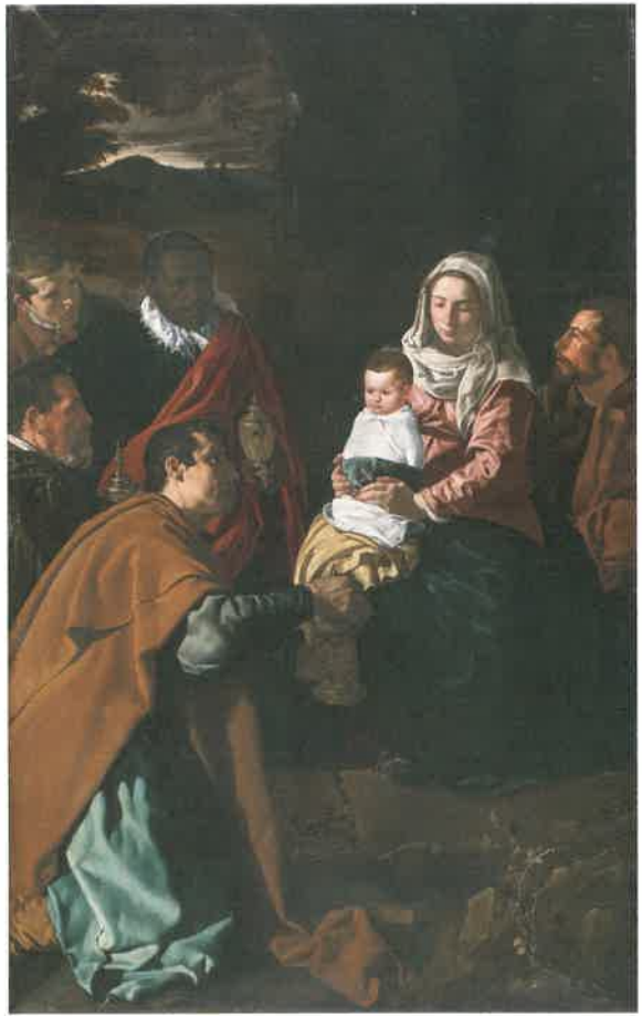
ディエゴ・ベラスケス《東方三博士の礼拝》 1619年