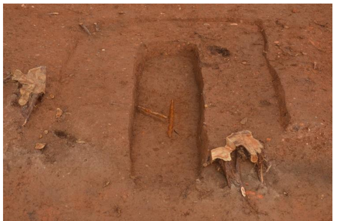
写真6 3号墳 埋葬施設と副葬品（鉄刀等）出土状況