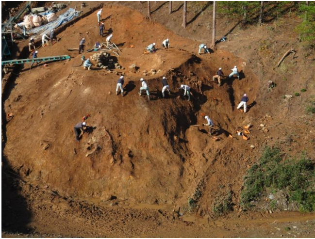
写真2 1号墳 調査風景（東から）