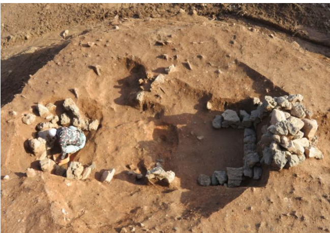
写真3 1号墳 石室検出状況（西から）