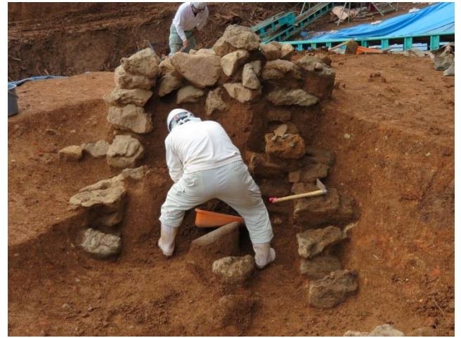
写真4 1号墳 石室調査風景（北東から）