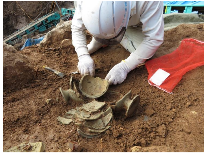
写真5 1号墳 土器出土状況