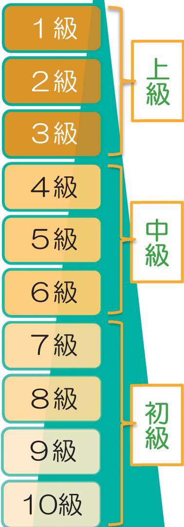
兵庫モデル評価表（ビルクリーニング部門ダスタークロスの抜粋）