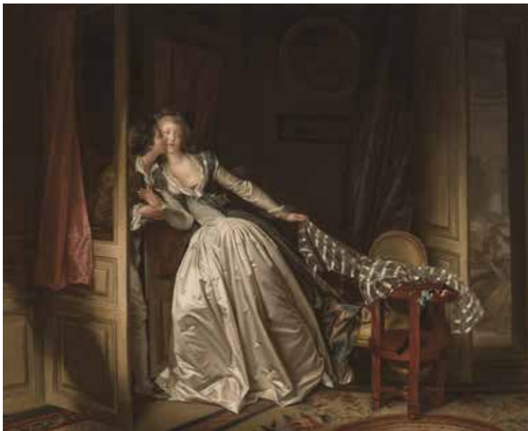
6. ジャン＝オノレ・フラゴナールとマルグリット・ジェラルド《盗まれた接吻》1780年代末

17世紀フランスは絶対王政を確立し、ルイ14世親政期(1661-1715年)には、財務長官コルベールの重商主義によって他の西洋諸国を凌ぐ豊かで強力な国となりました。王立絵画彫刻アカデミーもコルベールによって再編され、美術において中央集権体制を支える柱となりました。その教義の多くは、厳格な秩序と安定した絵画世界を追求するプッサンの古典主義様式に由来します。