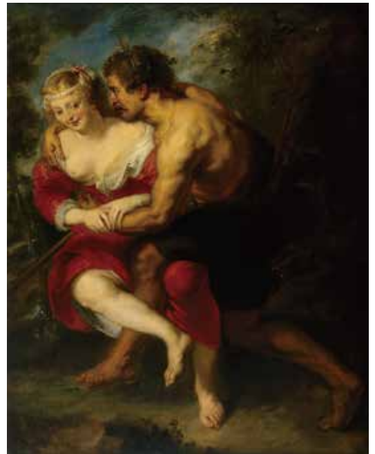
3. ペーテル・パウル・ルーベンスと工房 《田園風景》1638-1640年頃

17世紀前半のアントウェルペンで活躍したヴァン・ダイクやスネイデルスなどの重要な画家の大半は、ルーベンスの工房で修業をしたり、共同での制作をしたりしていました。とはいえ、彼らは単なる助手や弟子というわけではなく、静物や風景などを描く各分野の専門家として工房制作に参画して作品の質の向上に大いに貢献しました。こうしてルーベンスという巨大な存在を中心にして様々な才能が開花し、豊穡なバロック絵画が結実していったのです。