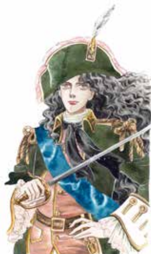
参考 池田理代子「女帝エカテリーナ」