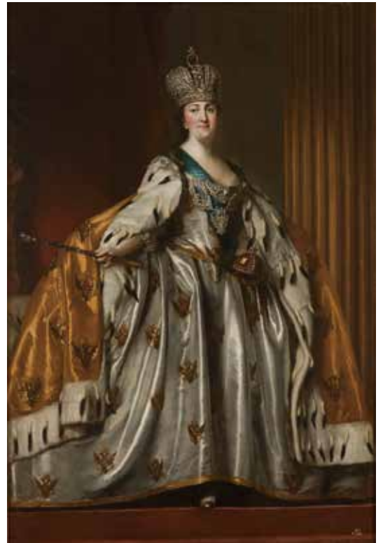
1. ヴィギリウス・エリクセン 《戴冠式のローブを着たエカテリーナ2世の肖像》1760年代 ©The State Hermitage Museum, St Petersburg, 2017-18

エルミタージュ美術館の多岐にわたるコレクションの中でも本展で主にご紹介するのは、ルネサンスからバロック、ロココにいたる16世紀から18世紀にかけての巨匠たち、いわゆるオールドマスターと称される西洋画家の作品です。この時代、西洋社会は宗教改革と対抗宗教改革、絶対王政と市民革命など、度重なる秩序の変転を経験しました。その進む方向も速度も国・地域によって異なり、絵画の主題や様式も各国・地域の社会的な事情を大いに反映したものとなります。本展は国・地域ごとの章構成とすることで、それぞれの国・地域の人々がこの時代、どのような絵画を愛したかが見て取れるようになっていきます。