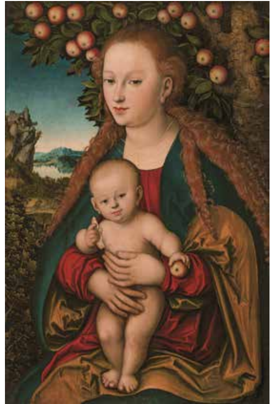
7. ルカス・クラナハ《林檎の木の下の聖母子》

16、17世紀のイギリスは、教会政策の動揺や清教徒革命、名誉革命などによる混乱で国内は不安定な状態が続き、その間絵画も他国の影響下にありました。政情が安定し、経済力もつき始めた18世紀以降、イギリス絵画の質は次第に向上します。この時期、フランドル出身のヴァン・ダイクなどの影響を消化して、冷静な優雅さを湛えた肖像画を描くゲインズバラのような優れた画家を出しました。