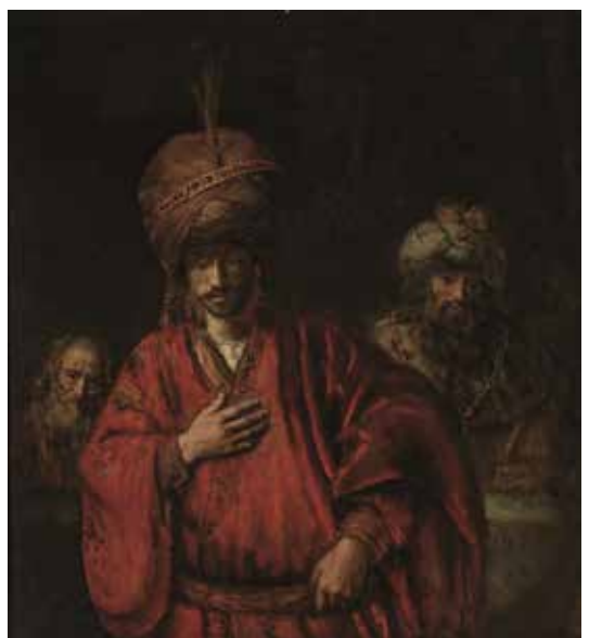
4. レンブラント・ハルメンスゾーン・ファン・レイン 《運命を悟るハマン》1660年代前半

「現実の鏡」とも呼ばれるほどの迫真の描写力で日常的な事物をとらえたオランダ絵画は、広く市民に愛されて家庭の壁を飾るとともに、その市民生活全体の繁栄ぶりを伝える鏡ともなっていました。