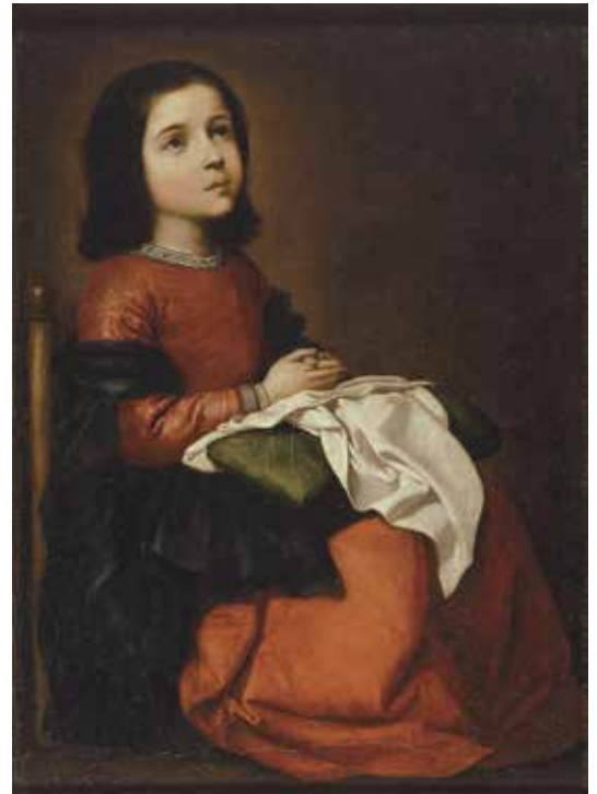
5. フランシスコ・デ・スルバラン 《聖母マリアの少女時代》1660年頃

対抗宗教改革を推進したフェリーペ2世の後を受けたこの時代のスペインでは、人々を禁欲的で敬虔なカトリック信仰に導く宗教美術が推進されました。スペインの宗教画の特徴は、聖書の伝説を身近な現実のエピソードとして理解する点にあります。まるで市井の少女であるかのように聖母を描いたスルバランの《聖母マリアの少女時代》、巷の孤児や庶民に多く取材したムリーリョなどは、その代表格といえるでしょう。これらは宗教画として人々に信仰の精神を伝えながら、政治・経済的には衰退の時を迎えていた同時代スペインの人々の暮らしを映しだしています。