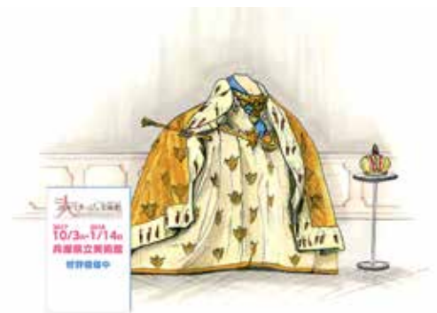
参考 写真撮影コーナー (イメージ)