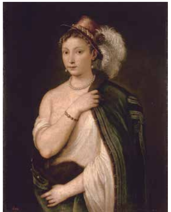
2. ティツィアーノ・ヴェチェッリオ 《羽飾りのある帽子をかぶった若い女性の肖像》1538年

このようにしてイタリアはルネサンスやバロックの美術を主導してヨーロッパ各国の芸術家に強い影響を与えながら、西洋絵画の新たな出発点となっていったのです。