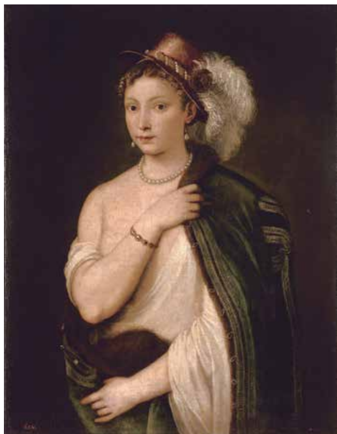
2. ティツィアーノ・ヴェチェッリオ 《羽飾りのある帽子をかぶった若い女性の肖像》1538年

OLD MASTERS FROM THE STATE HERMITAGE MUSEUM