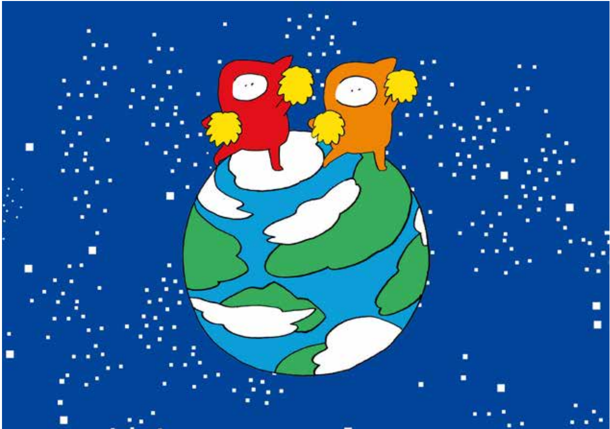
1. 「作家による作品イメージ」2016年