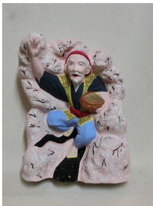
葛畑人形（花咲じいさん）／当館蔵