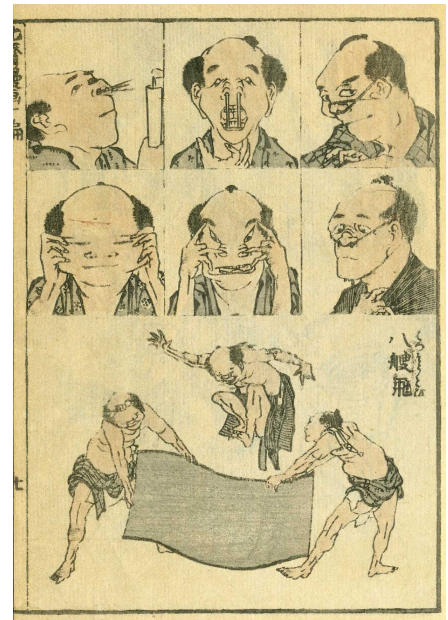
北斎漫画 (10 編/顔芸ほか) / 当館蔵