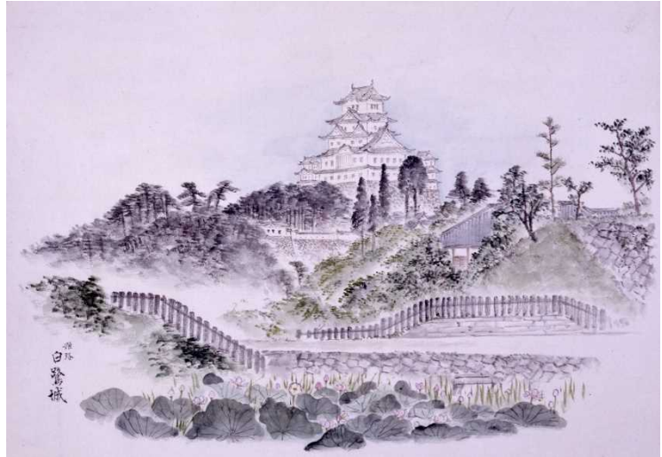
6 日本真景（垂水・播磨名所／姫路 白鷺城）