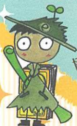
協力：兵庫県立図書館