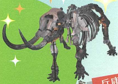
兵庫県立人と自然の博物館