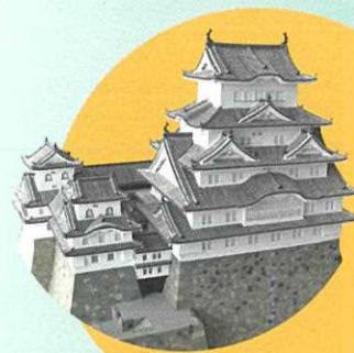
兵庫県立歴史博物館