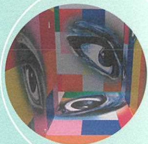
横尾忠則現代美術館