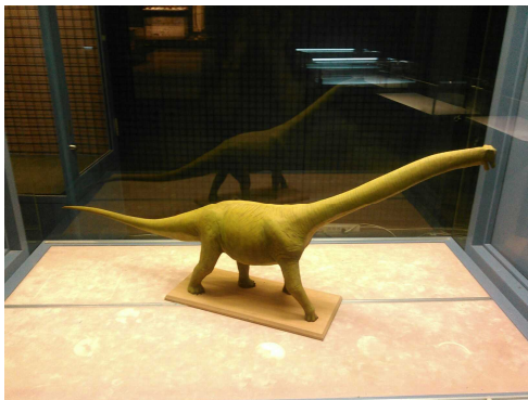
写真：生体復元模型