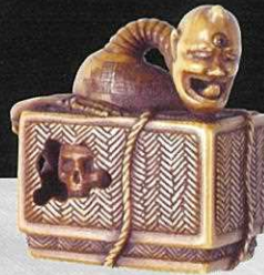
象形彫根付 舌切雀 大阪市立美術館蔵

平成21年度の特別展「妖怪天国ニッポン—絵巻からマンガまで—」では、江戸時代からの妖怪画の系譜について紹介しましたが、今回の展覧会では、妖怪の立体造形物に焦点を当てて紹介してみたいと思います。