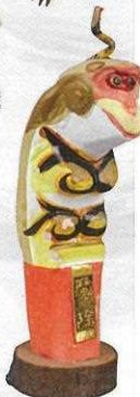
伊豆長岡のぬえボール