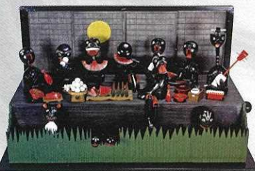
神戸人形 月見宴会