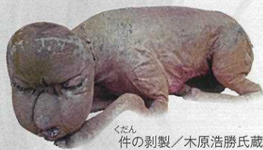
くだん 件の剥製 / 木原浩勝氏蔵