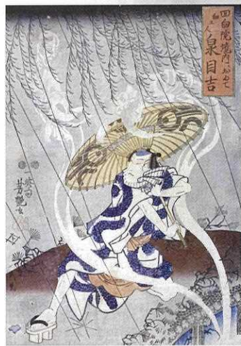
泉目吉細工人形 / 歌川芳艶画