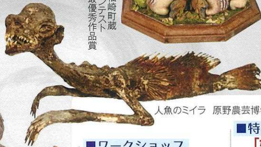
人魚のミイラ 原野農芸博物館蔵