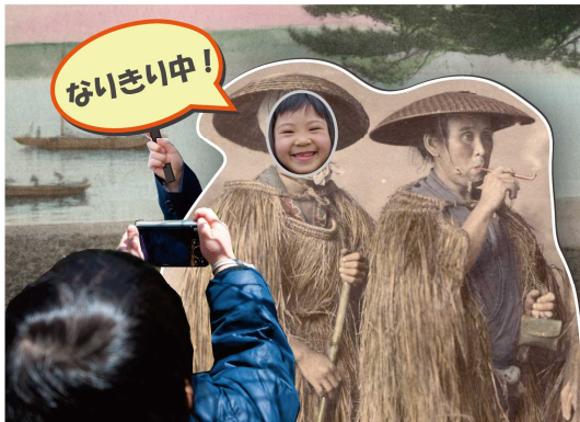
写真：なりきり古写真コーナー（イメージ）