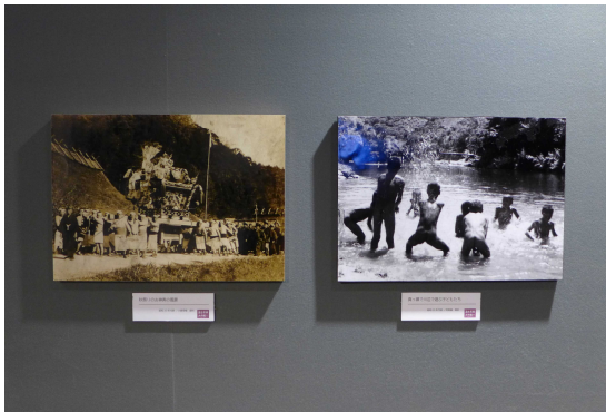
写真：昔の自然や生活が写る県内の古写真