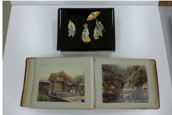
写真：幕末から明治期の風景写真集