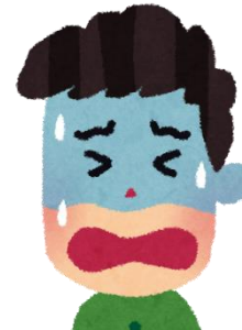
すごく痛くて とてもつらい