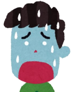
たえられないほど 痛い