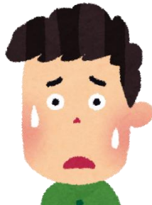
すこし痛くてつらい