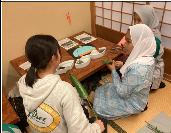
部活動体験・華道体験の様子