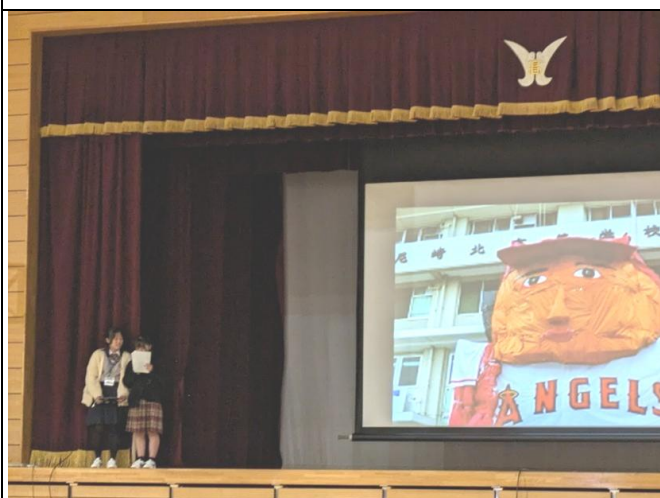
日本から学校紹介と文化紹介