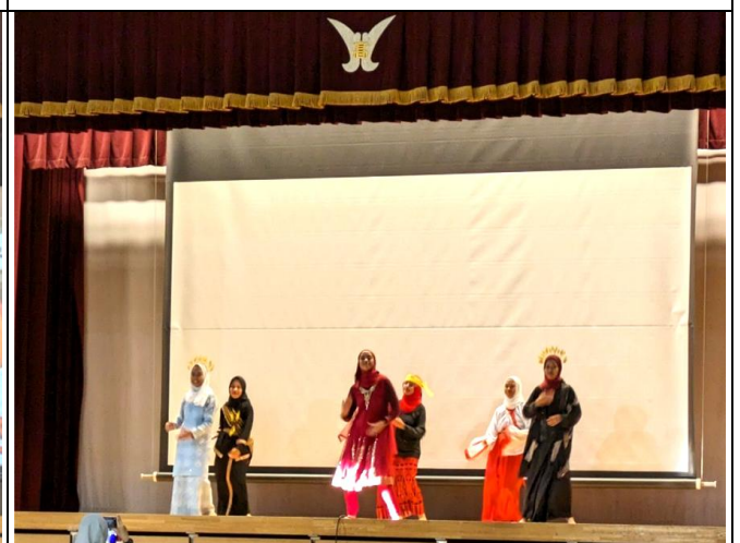
マレーシアの民族舞踊 それぞれの民族を代表する衣装だそうです