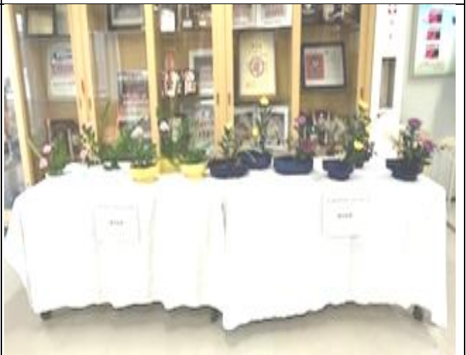
作品は現在、正面玄関に展示中