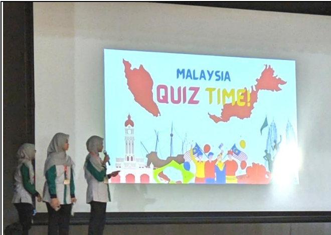
続いてマレーシアのクイズ