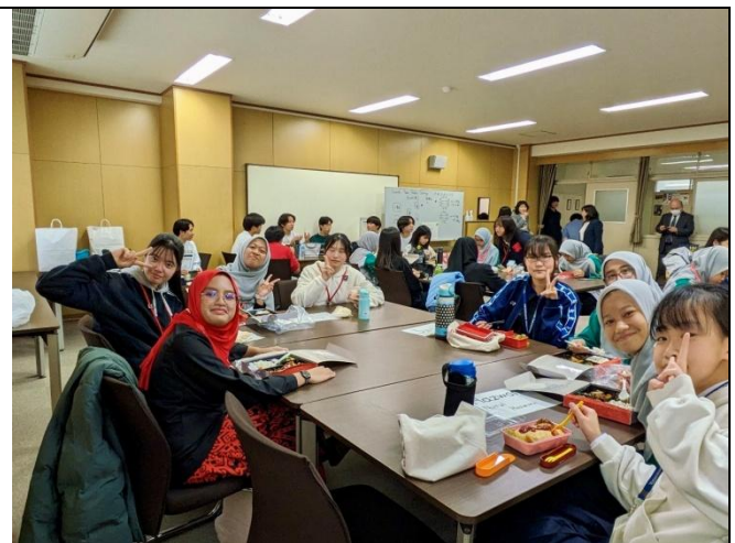
すぐに打ち解けました!