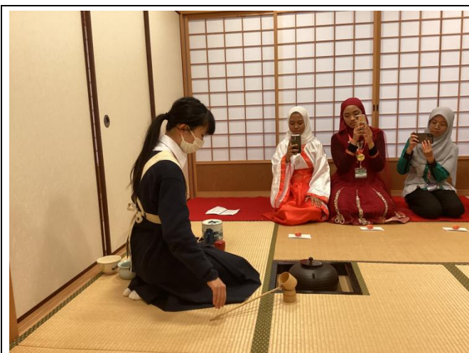
茶道部の体験 お手前に興味を持ってもらえました