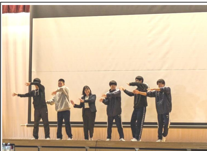
日本からは盆踊りの紹介