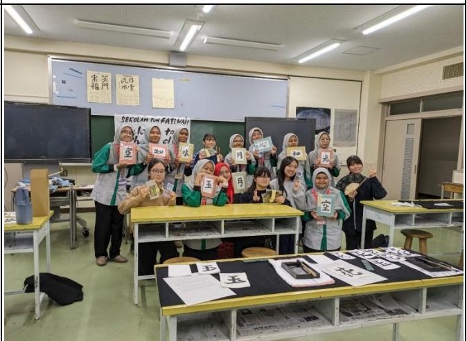
作品を持って記念撮影