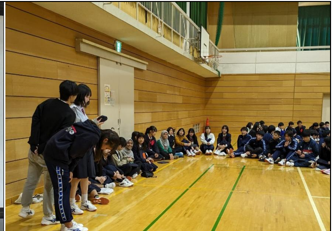
日本からのクイズはクラスごとで出題!