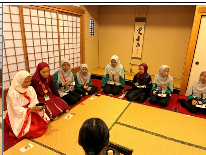
主菓子やお茶の飲み方の説明を真剣に聞いてくれました