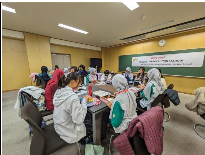
少し緊張しながら一緒にランチ(^^)