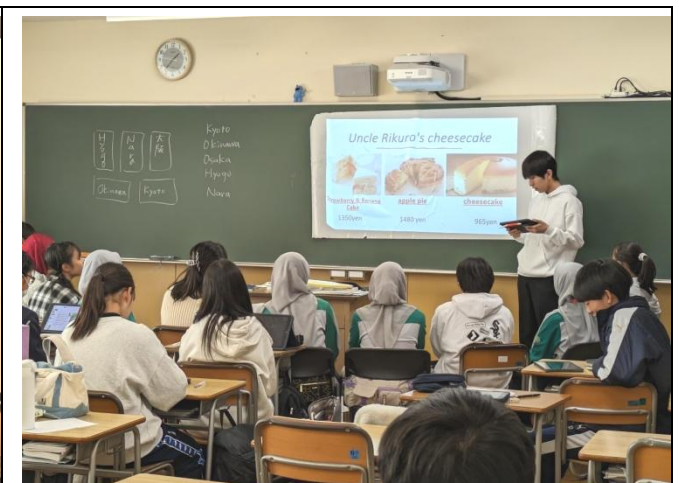
授業体験も行いました(英語・日本の旅行先おすすめ紹介)