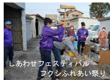
しあわせフェスティバル フクシふれあい祭り