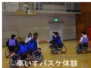
車いすバスケット体験