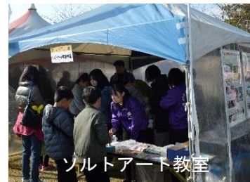
ソルトアート教室

地域のイベントでのブース出店、復興支援ボランティア活動、地域清掃活動、防災教室など、様々なことが体験できます。