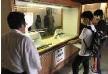
大石神社義士資料館 見学