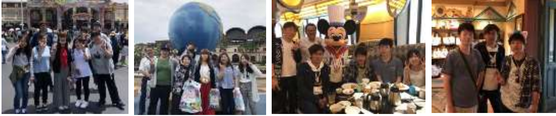
ホテルの朝食にて！ 買い物中！