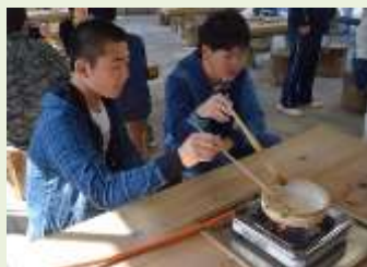
「かん水」を沸騰させて