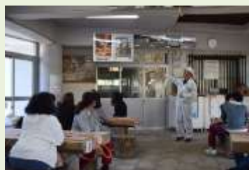
赤穂の塩作りについて

りゅうかしきえんでん 流下式塩田で塩分を濃くした「かん水」を煮詰めて塩を作る体験です。