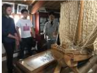
坂越まち並み館見学