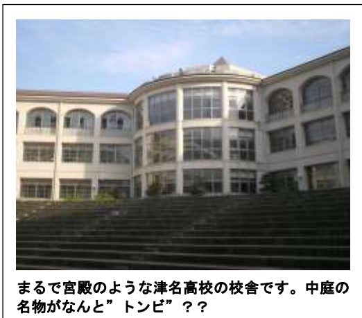
まるで宮殿のような津名高校の校舎です。中庭の名物がなんと”トンビ”??