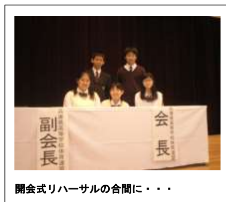
開会式リハーサルの合間に・・・

さて、6月5日(日)、NHK杯兵庫県大会第3地区予選が県立津名高校を会場に開催されました。この日は午前中、傘が壊れるくらいに風雨が強くどうなるかなと思いましたが、時間と共に天気も回復し無事に大会を実施することができました。明石高校の結果は、個人部門では、アナウンス部門で佳作1(明石市内の学校では1番ですが・・・)、朗読部門で入選2(個人部門で3年ぶりに県大会進出)・佳作1、番組部門ではラジオドラマ部門で佳作1でした。県大会では、朗読部門に加えてテレビドラマ部門、テレビドキュメント部門に参加します。“明石高校初”の決勝進出、そして全国大会を目指してチャレンジです。