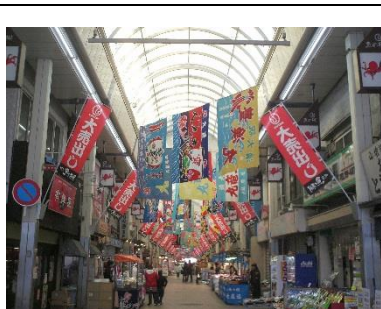
魚の棚に“大漁旗”がはためき、

アツという間に12月、今年もルミナリエの時期です。期末考査直後、明石市主催の“音読・朗読発表会”に参加しました。当日の受付が「12月12日12時から」と12が三つも並びました。これまでで最多の5名が参加しました。また、学期末の各講演会にも運営に司会進行にと取り組みました。