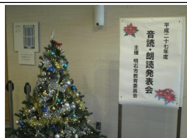
もう年末・年始、アツという間です・・・

そして、今年の最後にサプライズ！！明石市より、“戦後70年平和の集い”への取り組みで演劇部と共に感謝状をいただくことができました。