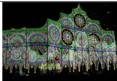
ルミナリエの灯りが輝き、