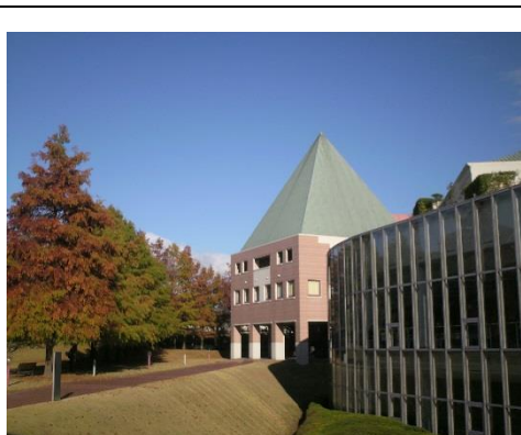
晩秋の大阪芸術大学伊丹学舎で