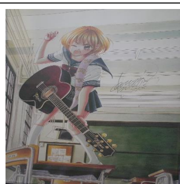
キャラクターにパワーをもらって大会は進みました。

アツという間に12月、今年もルミナリエの時期です。期末考査直後、明石市主催の“音読・朗読発表会”に参加しました。当日の受付が「12月12日12時から」と12が三つも並びました。これまでで最多の5名が参加しました。また、学期末の各講演会にも運営に司会進行にと取り組みました。