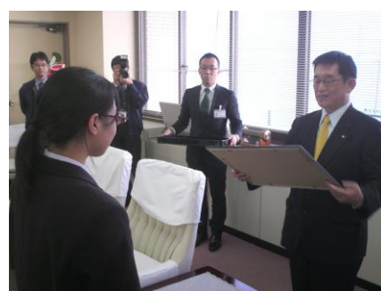
明石市長より”感謝状”をいただきました。

受検生のみなさん、是非明石高校にチャレンジしましょう。そして、放送部に参加してください。「放送部だからできる」ことも多くあります。高校生活をより充実させ共に“全国”へ行けるよう、共に前進して行きましょう。待っています。