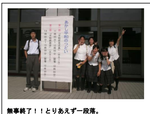
無事終了！！とりあえず一段落。