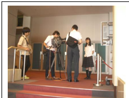
取材を受けています。

さて、これで夏休み前半は終了です。ここからしばらくは活動休み期間に入ります。この間に、各自が夏季課題の作成に取り組みます。ここでがんばることが2学期へと繋がります。がんばって欲しいです。活動の再開は8月下旬です。ここでは現役アナウンサーによる研修、総合文化祭オーディション、体育大会へ向けて機材の確認などをしていきます。これから何かと忙しいです。でも、高校生は忙しくて当たり前・・・。元気にやって行きましょう。