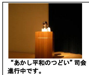
“あかし平和のつどい”司会進行中です。