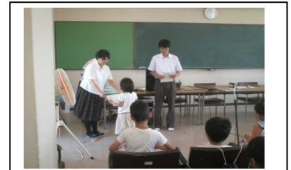
がんばった小学生に“修了証”を授与。