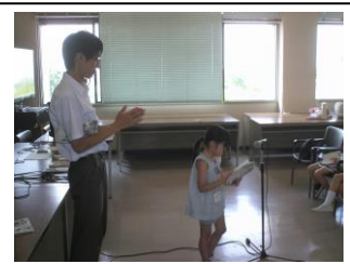
一人ひとり発表です。