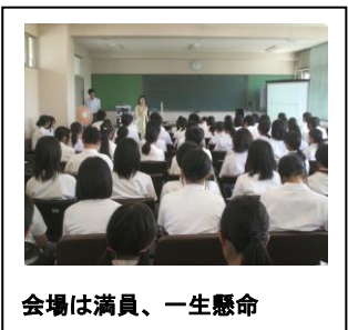
会場は満員、一生懸命