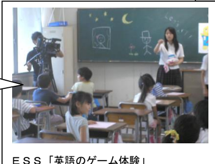
ESS「英語のゲーム体験」