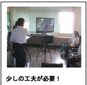
少しの工夫が必要！