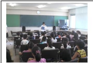
今回の説明をしています。