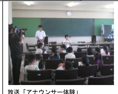
放送「アナウンサー体験」