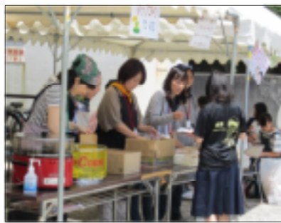
▲PTAの模擬店 (ポップコーン)

第四号に引き続き相高祭をご紹介します。第五号では模擬店(バザー営業)の様子です。真夏のような日差しの中、保護者の方をはじめ、たくさんの方々にお越しくださいました。今年、耐震工事の関係で、ロータリー付近、グランド東側の仮設校舎付近に分かれての販売となりました。バザーは三年生全クラスで行なわれ、午前9時から午後3時までの開催です。