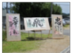
▲会場の様子(アト部書道班パフォーマンスによる作品)

(以下、生徒感想) 今回のバザー部門では最優秀賞をとることができてとてもうれしかったです。ソバ飯を作るにあたって、事前準備には大変苦労しました。また、当日食中毒が出ないように全員が細心の注意を払い、調理に当たりました。今回のバザーで協力し合ったことは高校生活の良き思い出になりました。(三年男子) 今回初めてアトラクション部門ができ、企画や運営の仕方がわからないながらに準備を始めましたが、ストラックアウトに決まり、意見を出し合って完成させることができました。相高祭当日は小さな子供から、大人の方まで多くの人に体験していただき、楽しんでいただくことができました。とても楽しい相高祭になりました。(三年女子)