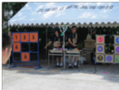
▲3年2組の模擬店 (ストラックアウト) 【3年バザー-アトラクション部門最優秀賞】