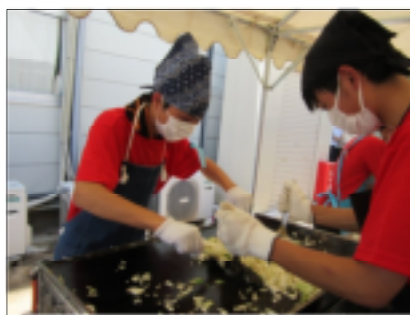
▲3年1組の模擬店 (ソバめし他) 【3年バザー-食品部門最優秀賞】