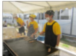
↑3年6組の模擬店 (焼き鳥)