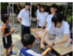
↑3年3組の模擬店 (あめすくい)