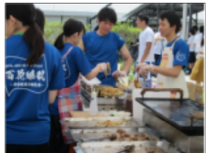
▲生徒会の模擬店 (ホルモン焼きうどん)