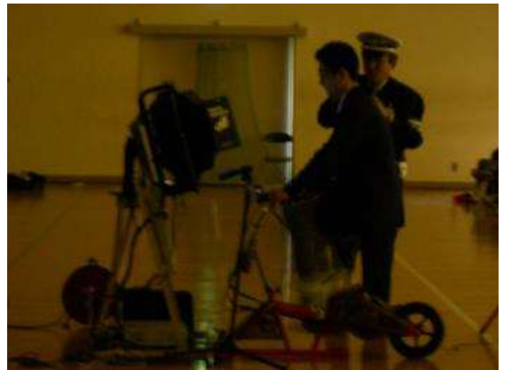
シュミレーターでの体験