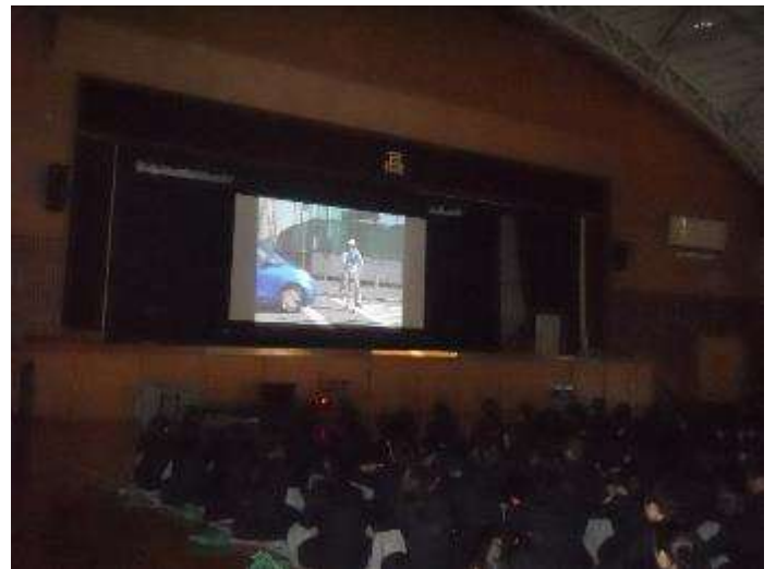
DVDでの危険運転の確認