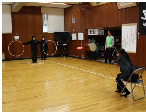
生涯スポーツ競技を実践する様子 (校内スポーツ大会にて)