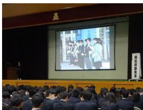
生徒授業・活動体験発表会の様子