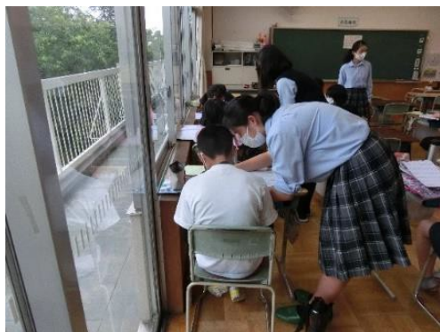
NATSUGAKU (学習指導) のお手伝いの様子 (高砂小学校にて)