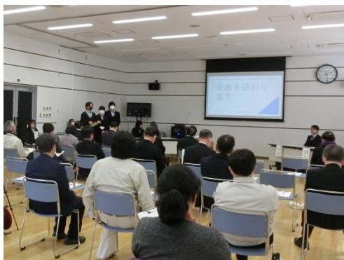
高砂市職員に学習成果を発表する様子 (高砂市役所にて)