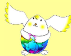
テラたま (イメージキャラクター)

ホームページ http://www.hyogo-c.ed.jp/~mc-center/