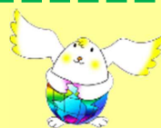
テラたま (イメージキャラクター)

発行元 子ども多文化共生センター (TEL 0797-35-4537) 発行日 2022(令和4)年3月23日(水) ホームページ http://www.hyogo-c.ed.jp/~mc-center/