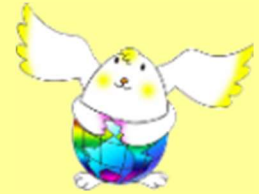
テラたま (イメージキャラクター)

ホームページ http://www.hyogo-c.ed.jp/~mc-center/