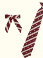
RIBBON & TIE