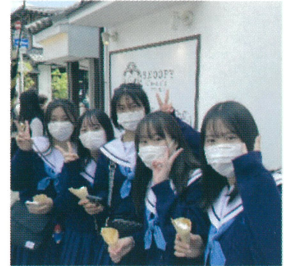
4 月 校外学習