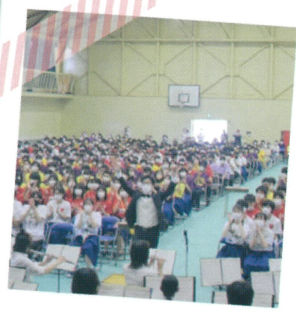
6 月 文化祭