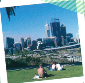
8 月 海外語学研修