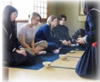
本校での茶道体験

1989年より、アメリカ合衆国ワシントン州ヴァッシュンアイランド高校との交流を行っています。国際理解、語学教育を目的に、約20人の生徒が春休みの10日間、隔年で相互の学校を訪問します。2020年度は新型コロナウイルスの影響で訪問ができなかったため、風呂敷の使い方を説明する動画を作成し、メールで送るなど、工夫して交流しました。