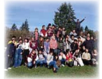
ヴァッシュンアイランド訪問