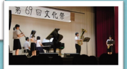
6月 文化祭 音楽類型発表