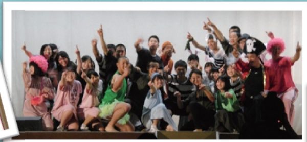
6月 文化祭 クラス劇