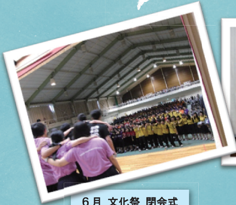
6月 文化祭 閉会式