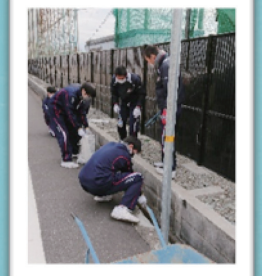
クリーンアップ作戦（全学期）