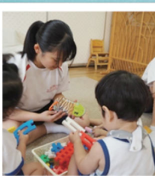
ふれあい育児体験