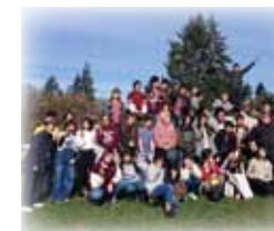
ヴァッシュンアイランド訪問