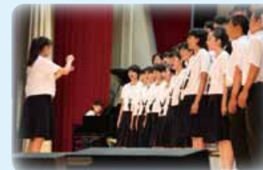
文化祭（クラス合唱）

文化祭のクラス合唱では、元々パートで別れているクライマックスの部分を大きく歌いたいから全員で同じメロディーを歌うことに意見を出し合って変更しました。その結果、とても良くなったので、時には自分たちでアレンジする方がいいこともあるんだな、と分かりました。自分たちで工夫することで、楽しく練習出来ました。前に出るのが得意じゃなくても失敗を恐れずに思ったことを伝えていきたいと思いました。