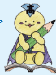
南高マスコット みなみん