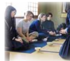
本校での茶道体験

I was very sad to leave Vashon but this experience is my treasure. I learned that communicating myself is more important than speaking English well. It's the most important to act by myself. (生徒の日誌より抜粋)